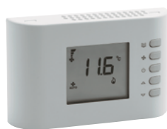
MANDO CR26 NO INCLUIDO DE SERIE.