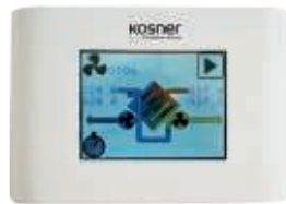
MANDO DE SERIE