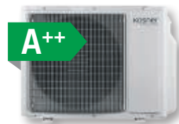
MODELOS: M3-24/71 MODELOS: M4-28/80