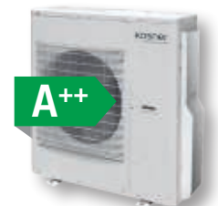
MODELOS: M4-36/100 MODELOS: M5-42/125